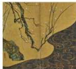
尾形光琳「紅白梅図屏風」(MOA美術館)