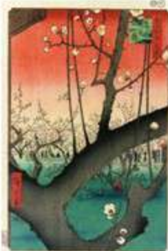
広重「江戸梅屋敷」(左)とゴッホの模写