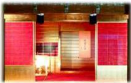
黄金の茶室 (MDA美術館)

その後、室町時代から安土・桃山時代にかけては内乱の時代、“応仁の乱”などというややこしい争いが11年も続き京都が焼け野原となります。この時代を席卷したのが信長と秀吉というやたら派手好きの武将でした。安土城や秀吉の“金の茶室”など贅を極めた装飾であらゆるものを飾りたてます。